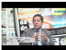
Ceará: secretário de Segurança defende formação, gestão e disciplina para futuras ações