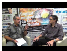
Sistema de consórcio: conheça as vantagens de planejar a aquisição de um bem